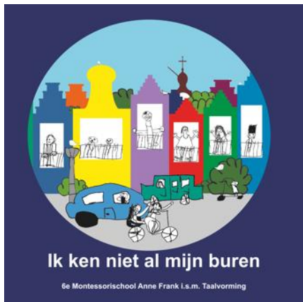
Voorbeeld: omslag 'De Stad' met kleuters