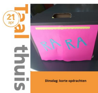
Taal thuis schooldag 24

Door middel van overheidssubsidies in verband met leerachterstanden organiseerden een aantal scholen en schoolbesturen in ons netwerk dit jaar zomerscholen. Samen met schoolbestuur Innoord hebben we een zomerschool verzorgd voor leerlingen die hiervoor in aanmerking kwamen. De eerste 2 weken en de laatste 2 weken van de zomervakantie hebben we een lessenserie verzorgd over 'de landen van de wereld'.