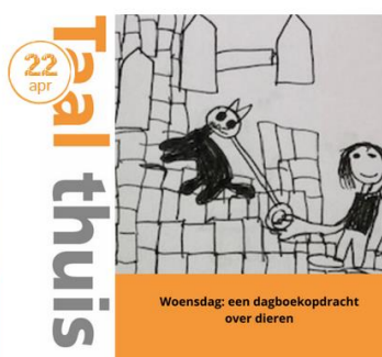
Taal thuis schooldag 25