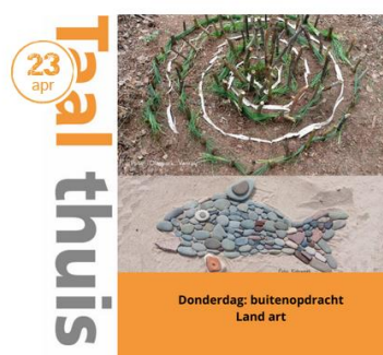
Taal thuis schooldag 26

Inhoudelijk betekende het feit dat we nauwelijks meer in de scholen actief konden zijn dat we de leerkrachten en de leerlingen op een andere manier moesten gaan bedienen. Vanaf de eerste schoolsluiting zijn we begonnen met Taal Thuis: les ideeën met creatieve taalopdrachten die leerkrachten kunnen gebruiken in het online onderwijs. Tijdens de eerste schoolsluiting postten we dagelijks een nieuwe les online, inmiddels verspreiden we wekelijks een nieuwe les en is er op onze website een grote database beschikbaar, met les ideeën gerangschikt op onderwerp en op taaldoel.