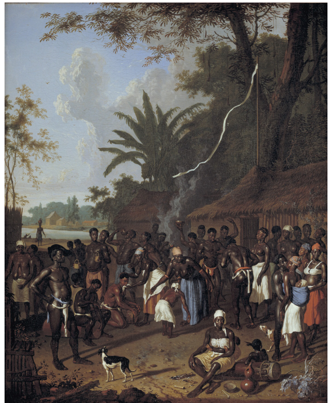
Titel: Samenkomst van tot slaaf gemaakten op een van de suikerplantages van Jonas Witsen Schilder: Dirk Valkenburg, 1708 Collectie: SMK, The National Gallery of Denmark KMS 376