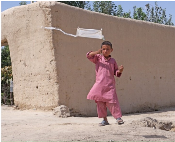
Taal bij de tentoonstelling van Francis Alÿs in het EYE