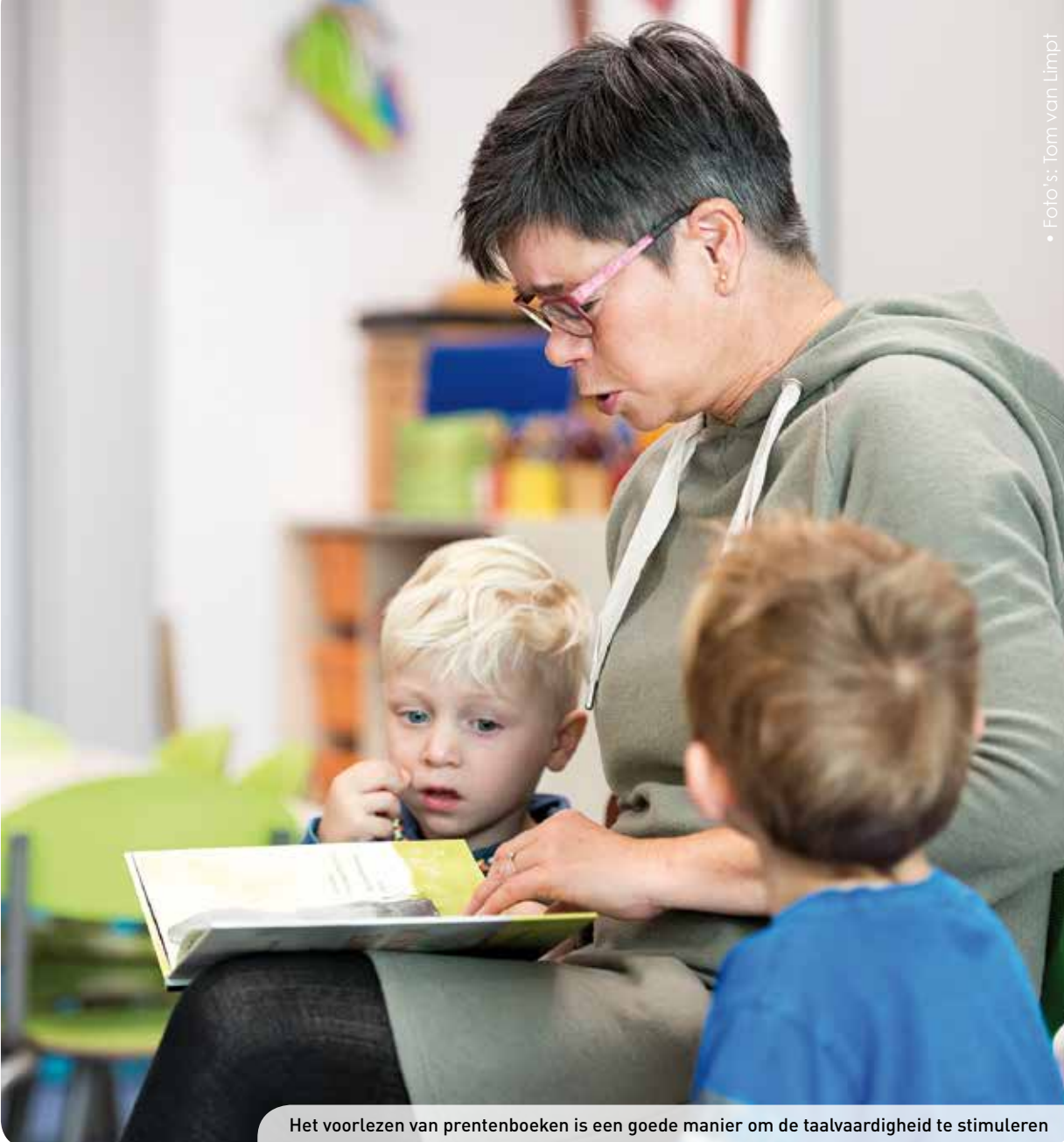
Het voorlezen van prentenboeken is een goede manier om de taalvaardigheid te stimuleren

'oever' is? Na het voorlezen bespreek je de voorspellingen: 'Waar gaat het boek over? Klopt het met wat we dachten?' Voordat je het boek voor de tweede keer voorleest, activeer je de voorkennis van de kinderen: 'Weten jullie nog waar dit boek over gaat?' Deze keer ga je in op belangrijke concepten. In Het Zwarte Konijn is dat het concept 'schaduw'. Zorg dus dat je daar regelmatig bij stilstaat. Bijvoorbeeld als Konijn zich achter een boom heeft verstopt: 'Hé, waar is het Zwarte Konijn nu gebleven? Wie weet waar het Zwarte Konijn is?' Of als Konijn in het donkere bos is: 'Zou het Zwarte Konijn nu echt weg zijn?' Na het voorlezen vat je samen: 'Dus wanneer is het Zwarte Konijn er? En wanneer niet?' Voordat je het boek voor de derde keer voorleest, activeer je de voorkennis van de kinderen: 'Wanneer zie je een schaduw?' Deze keer ga je in op gevoelens. In Het Zwarte Konijn gaat het vooral over bang zijn. Zorg dus dat je daar regelmatig bij stilstaat. Bijvoorbeeld als Konijn het Zwarte Konijn ziet: 'Hoe voelt Konijn zich nu? Hoe komt het dat hij bang is?' Of als Konijn Wolf tegenkomt: 'Ben jij ook weleens bang geweest? Waar was je dan bang voor? Wat heb jij toen gedaan?'