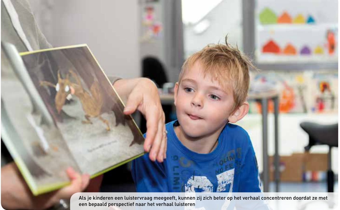
Als je kinderen een luistervraag meegeeft, kunnen zij zich beter op het verhaal concentreren doordat ze met een bepaald perspectief naar het verhaal luisteren

libellen en vissen noemen (dieren die alleen op de prenten staan, maar verder geen rol spelen), vraag je: 'Stel dat we deze dieren niet konden zien, zou het verhaal dan anders worden?' Voordat je het boek voor de tweede keer voorleest, activeer je de voorkennis van de kinderen: 'Over wie gaat het verhaal?' Stel dan de luistervraag: 'Waar speelt het verhaal zich af?' Vraag of de kinderen tijdens het voorlezen extra goed willen letten op welke plaatsen de dieren in het verhaal zijn. Na het voorlezen bespreek je de luistervraag. Vraag ook wat de kenmerken zijn van een plaats: 'Wat weten we van het bos?' Voordat je het boek voor de derde keer voorleest, activeer je de voorkennis van de kinderen: 'Over wie gaat het verhaal? Waar speelt het verhaal zich af?' Stel dan de luistervraag: 'Wat is het probleem in het boek en wat is de oplossing?' Vraag of de kinderen tijdens het voorlezen extra goed willen letten op de problemen en de oplossingen. Na het voorlezen bespreek je de