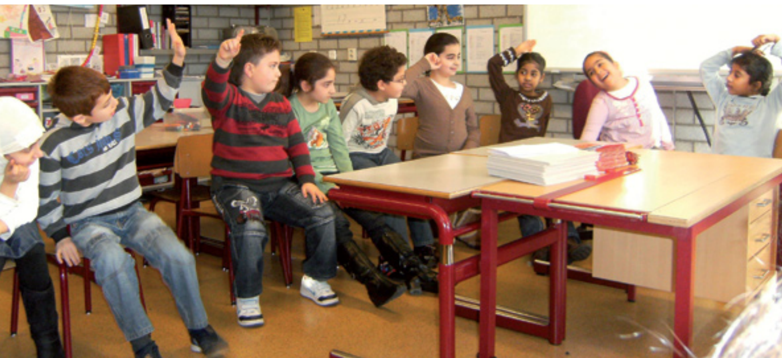
Taalronde in groep 4

De helft van het team van een grote basisschool zit op woensdagmiddag in een kring in een van de bovenbouwlokalen. Tijdens een taalronde over ervaringen met auto's heeft een juf een tekst geschreven. Ze beschrijft hoe ze per ongeluk haar baby in de auto opsloot door de sleutel binnenin te laten liggen. Die tekst staat nu op het smartbord te lezen. Haar collega's stellen haar vragen, over hoe ze de deur uiteindelijk open kreeg, of de baby in paniek raakte, wat ze zelf deed en voelde. We bespreken hoe haar tekst duidelijker kan worden, of er nog iets bij kan en wat het effect daarvan is. De juf heeft rode wangen gekregen, net als het meisje uit groep 8 in de film die we even later bekijken: precies zo'n tekstbespreking, maar dan met kinderen. Na de film ontstaat een levendig gesprek over de doelen van schrijf- en stelonderwijs.