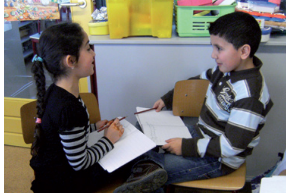
Tweetalgesprek groep 4

Taal is op veel basisscholen een speerpunt. Onder druk van tegenvallende toetsresultaten en de negatieve berichtgeving in de media, buigen scholen zich over de oorzaken van taalachterstanden en manieren om hun taalonderwijs te verbeteren. Aan de taalmethodes ligt het niet, die zijn steeds verder aangepast aan gemengde schoolpopulaties en aan de nieuwste inzichten op het gebied van woordenschatdidactiek. Het lijkt erop of het uitsluitend werken met één taalmethode niet voldoende is om alle soorten kinderen taalvaardiger te maken.