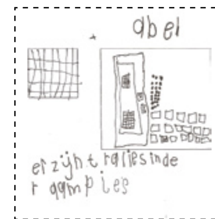
Taaltekening groep 3

"Het lijkt erop of het uitsluitend werken met een taalmethode niet voldoende is om alle soorten kinderen taalvaardiger te maken."